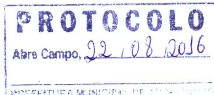
Márcio Moreira Vítor Prefeito Municipal